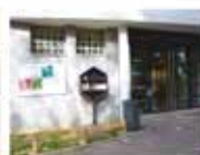
Des boîtes pour lire des livres !