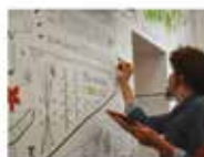
Zoom sur la fresque de l'Hôtel de Ville