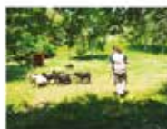
Éco-pâturage : petit rappel