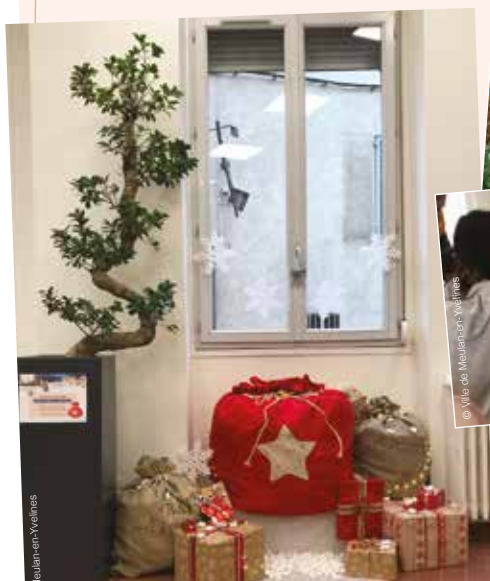
Beaucoup de petits Meulanais ont déposé leur enveloppe dans la hotte que le Père Noël avait laissée à l'accueil de la Mairie.