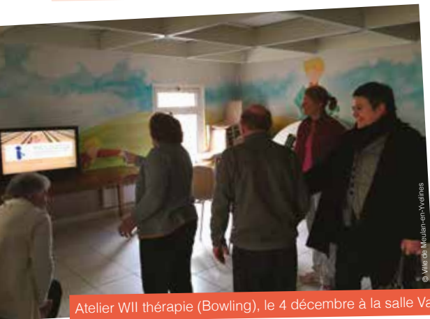
Atelier Wii thérapie (Bowling), le 4 décembre à la salle Valéry.