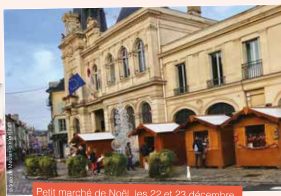
Petit marché de Noël, les 22 et 23 décembre.