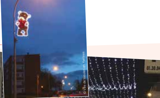
Illuminations de Noël dans votre Ville.