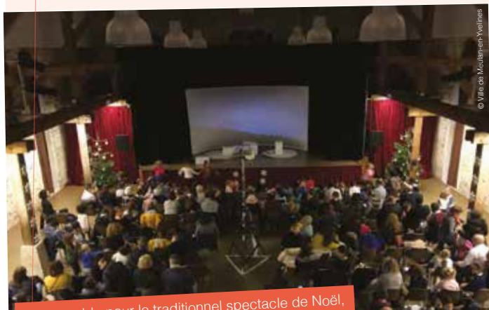
Salle comble pour le traditionnel spectacle de Noël, le 8 décembre à la Bergerie.

Les plus chanceux ont même pu rencontrer le Père Noël en personne qui leur a promis de revenir l'année prochaine s'ils sont toujours sages.