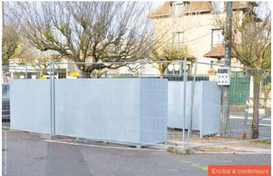
Enclos à conteneurs

Un enclos pour les conteneurs à poubelles du marché a été installé au niveau de l'entrée du parking. Cette réalisation a le double avantage de mettre fin à la disposition anarchique des poubelles sur les places de parking, la place réservée aux PMR, le passage piéton ou encore dans le square à proximité et d'éviter l'exposition des conteneurs à proximité des étals de commerçants les jours de marché. Par ailleurs, elle permettra de faciliter le ramassage des déchets du marché par le camion de collecte.