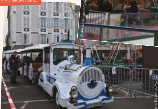
Comme chaque année, le petit train reliait Meulan Paradis au centre-ville, les 22 et 23 décembre.