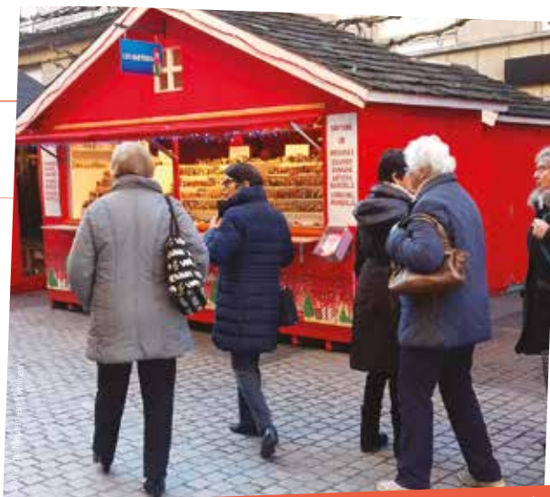
Visite du marché de Noël d'Amiens, le 4 décembre.