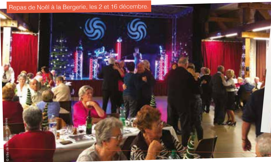
Repas de Noël à la Bergerie, les 2 et 16 décembre.