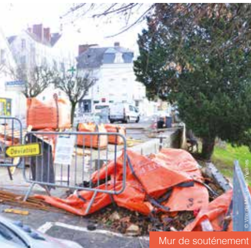
Mur de soutènement

Le marché du centre-ville a été impacté durant tout le mois de décembre 2018 par les travaux de réhabilitation du mur de soutènement situé à proximité du pont aux Perches qui menaçait de s'effondrer. Les services de la Communauté Urbaine Grand Paris Seine et Oise ont ainsi remis en état et renforcé ce mur permettant de récupérer de l'espace supplémentaire pour le marché et des places de stationnement les autres jours.