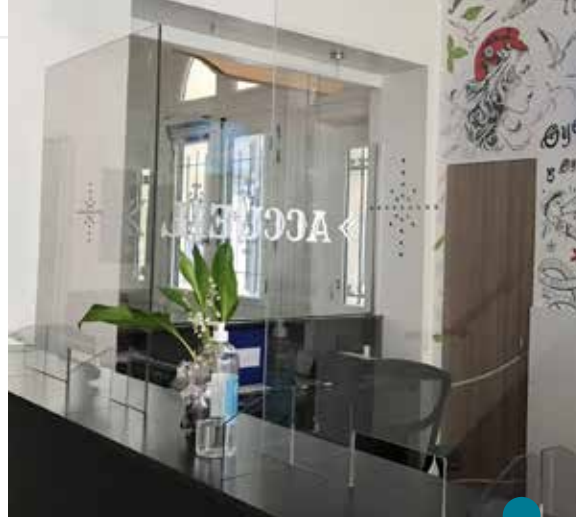
Hygiaphone pour le service d'accueil de la mairie

Du 3 août au 29 août inclus : du mardi au vendredi : 8h30 - 12h30 et 13h30 - 17h (sauf mardi après-midi) et samedi : 8h30 - 12h