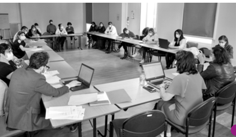
La cellule opérationnelle de crise du CHIMM réunie le vendredi 29 mai, dans le respect des mesures de distanciation physique. (P. BIERRET)

Pour terminer, j'insiste sur le fait que la meilleure des protections pour le grand public, c'est le respect des mesures barrières et la distanciation physique, avec un lavage très fréquent des mains mais aussi le port d'un masque quand la distance d'un mètre ne peut être respectée.