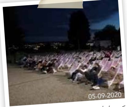
Certains courageux ont bravé le froid pour venir voir l'Opéra de Mozart en plein air.