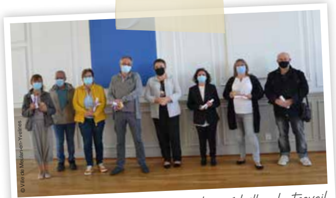
Cérémonie de remise des médailles du travail le samedi 26 septembre