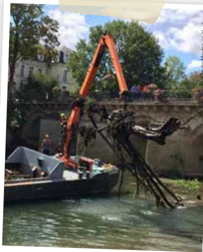
Coup de propre sur la Seine sous le pont aux Perches mardi 18 août.